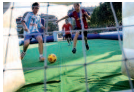
El 3x3 de futbol al carrer va comptar amb la participació de 16 equips