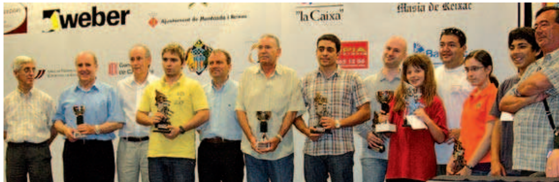
Els guanyadors de les diferents categories de l'Open Vila de Montcada a mb les autoritats municipals i els representants de la UE Montcada