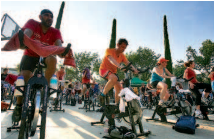
La marató d'spinning va omplir la plaça Lluís Companys el 12 de juliol amb un centenar de participants

Un altre de les activitats que també ha estat un èxit de participació durant el mes de juliol és el Campionat de Natació Vila de Montcada, que enguany ha arribat a la dotzena edició. El torneig va reunir més d'un centenar de nedadors de totes les edats entre les categories de prebenjamí fins a adults. La jornada,