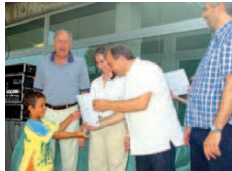
Un dels nens que ha fet el campus de Carles Reixac recull el seu diploma

l'any passat i, cara al futur, volem que sigui molt millor" , va indicar l'edil. L'acte també va comptar amb la presència de l'alcadessa, Maria Elena Pérez (PSC), qui va encoratjar els petits a continuar aprenent. D'altra banda, la diada de 3x3 de futbol al carrer va acollir el 6 de juliol un total de 16 equips participants entre infants i adults. La iniciativa, organitzada per l'IME i el Futbol Sala Mausea Montcada, es va fer davant del pavelló Miquel Poblet. Grans i petits van competir en el marc d'un ambient festiu que va atreure força públic.