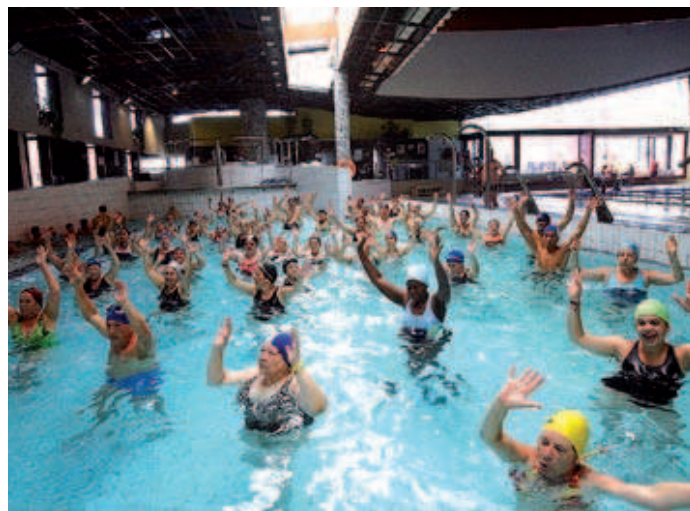
La classe d'aqua-gym a la piscina de Montcada Aqua va ser un gran èxit de participació durant la jornada solidària