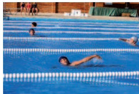
Els més petits també van ser protagonistes al Campionat local de natació