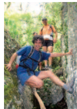
L'equip del CEAV al Raid EGAN de Collbató