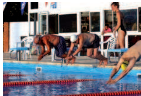
Els nedadors de més edat en l'inici de la seva prova al Campionat local